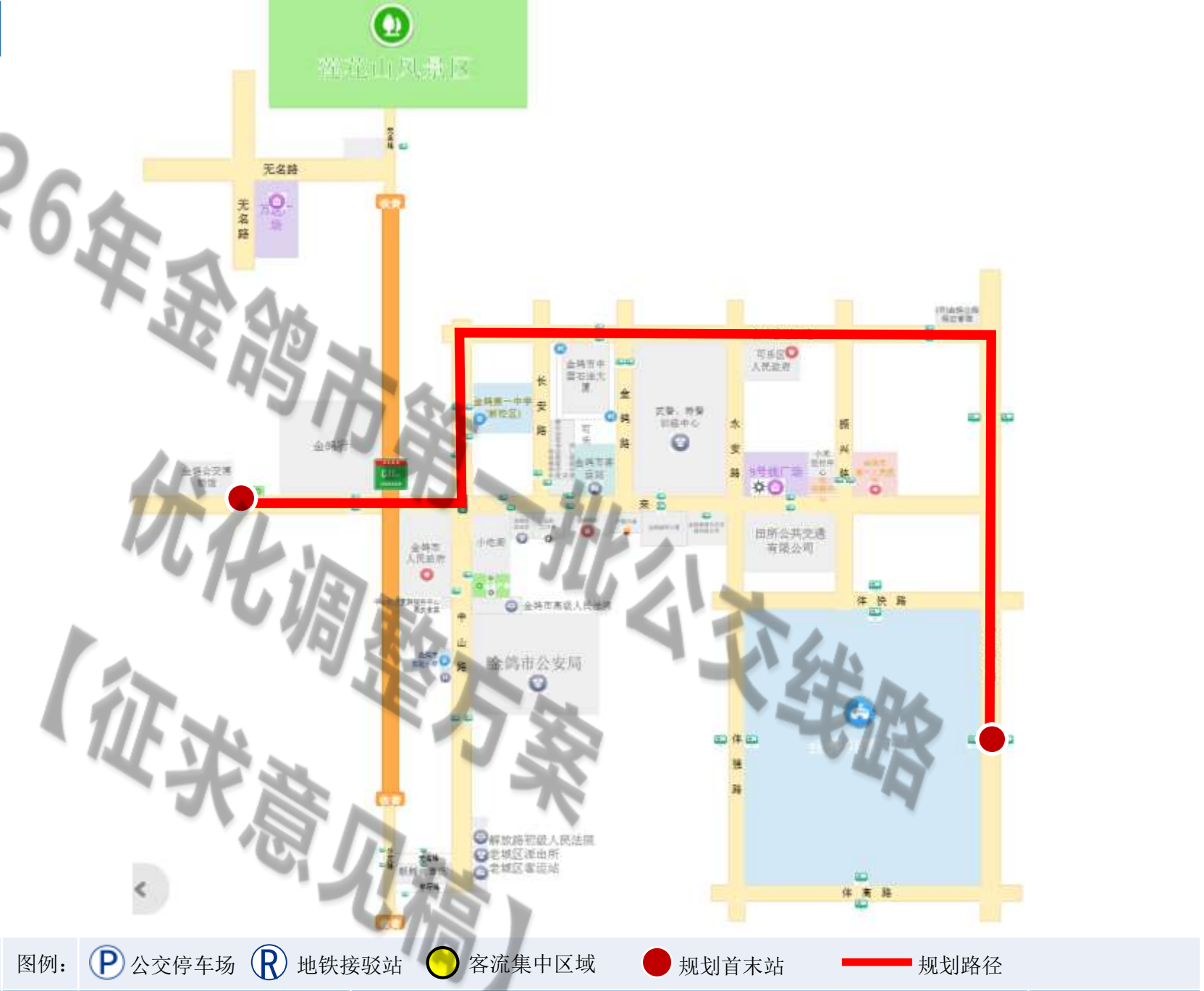
图名：新增城区快速公交线路6路规划图