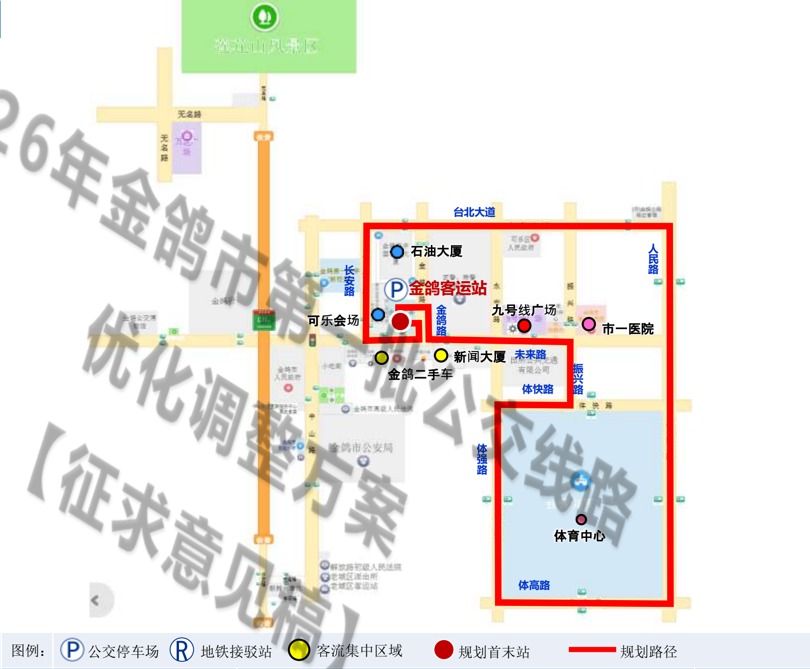
图名：新增城区环线H2路规划图

2、 调整理由： 为满足体育中心大型活动进场散场出行需求，加快推动公交网络与轨道协同优化、无缝衔接，促进轨道、公交高质量融合发展，解决体育中心西南区域公交服务盲点问题，接驳可乐会场等大客流断面，为市民提供便捷舒适、绿色环保的高品质出行服务。拟开通 环线H2路 ，着力解决市民出行“最后一公里”，实现“地铁送到站，公交送到家”，用金鸽客运站提升车辆调度能力，更大提升线路运营效率，全程用时约12分钟。